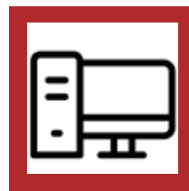
Salas de Cómputo-ISP