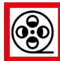
Cine y Entretenimiento